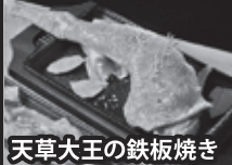
天草大王の鉄板焼き

※別注料理や注文は宿泊日の二日前まで受付致しております。 ※別途料金がかかります。詳細はお問い合わせ下さい。