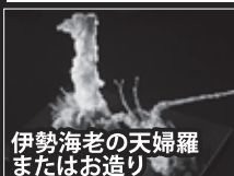
伊勢海老の天婦羅 またはお造り