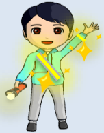
反射材に光があたると