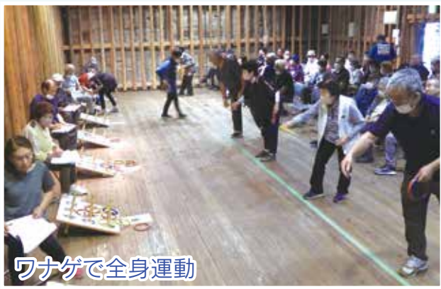
ワナゲで全身運動