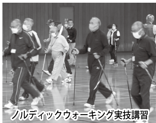
ノルディックウォーキング実技講習

昼食を挟んで、午後の部は、平成22年度から取り組みを開始し、もうすっかりお馴染みとなったノルディックウォーキングの実技講習です。