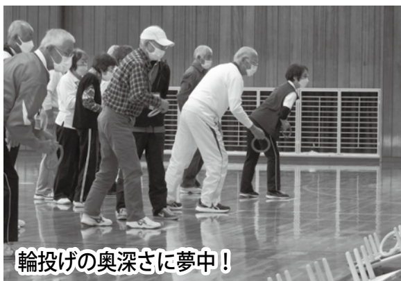
輪投げの奥深さに夢中!

この研修は、運動による高齢者の健康づくりを促進するため、市町村老連等における体育部長等、健康づくりを担当する方々を対象として実技講習を行い、市町村老連等に